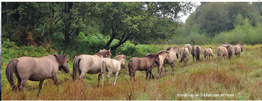
Koniks op de Slikken van de Heen