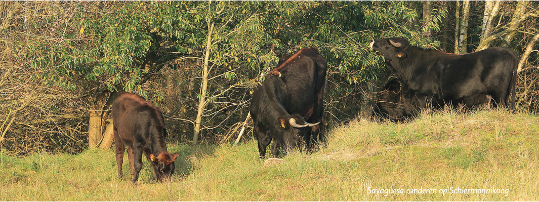
Sayaguesa runderen op Schiermonnikoog

Ook in 2015 werden de 14 medewerkers en free-lancers van onze stichting weer fantastisch ondersteund door een netwerk van zo'n 75 vrijwilligers. Verspreid over de verschillende gebieden zijn deze mensen georganiseerd in kleine netwerken en onmisbaar bij het toezicht en de voorlichting ter plaatse. Heel veel dank voor hun inzet is al getoond op de jaarlijkse vrijwilligersdag in juli maar is ook in dit jaarverslag op zijn plaats.