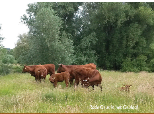
Rode Geus in het Geuldal