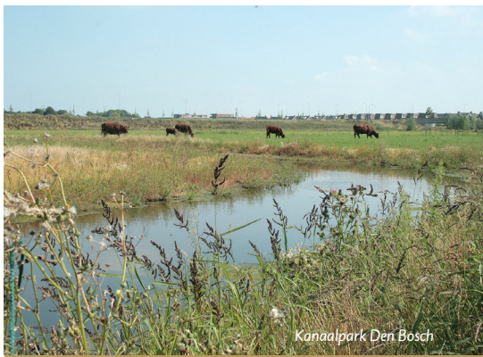
Kanaalpark Den Bosch

Waar dieren geboren worden, sterven ook dieren. Op de Landtong Rozenburg stierven binnen één week zowel de leidmerrie als de leidhengst. Om verschillende redenen heeft de beheerder beide dieren laten inslapen. De leidmerrie viel plots sterk af en na een bezoek van een dierenarts werd de diagnose oedeemvorming vastgesteld, wat duidt op een probleem met hart of darmen. De leidhengst had last van een acute vorm van hoefbevangenheid. Beide dieren liepen sinds de start van de konik begrazing op de Landtong Rozenburg. Het harem bleef achter zonder haar leiders en werd snel overgenomen door het andere aanwezige harem. Voor de dieren betekent dit dat ze opnieuw hun plekje in de sociale orde moeten vinden.