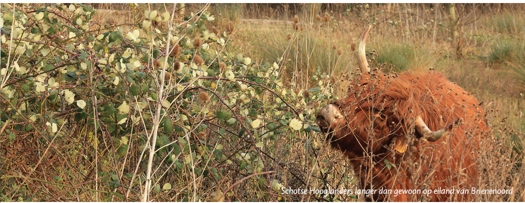
Schotse Hooglanders langer dan gewoon op eiland van Brieneoord