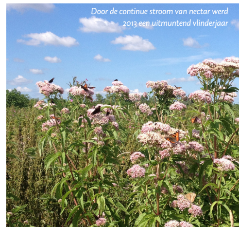
Door de continue stroom van nectar werd 2013 een uitmuntend vlinderjaar

De winter van 2013 duurde maar en duurde maar. Tot aan begin april bleef het regelmatig 's nachts vriezen waardoor het voorjaar pas zeer laat op gang kwam. Voor sommige gebieden, zoals het Munnikenland bij Loevestein en de Diezemonding bij Den Bosch, betekende dit dat er voor het eerst sinds jaren moest worden bijgevoerd. Doordat de winter laat op gang kwam had dit ook zijn effecten op de flora en de fauna. Er ontstond nu plotseling een bijna continue stroom van nectar waardoor 2013 een goed vlinderjaar werd