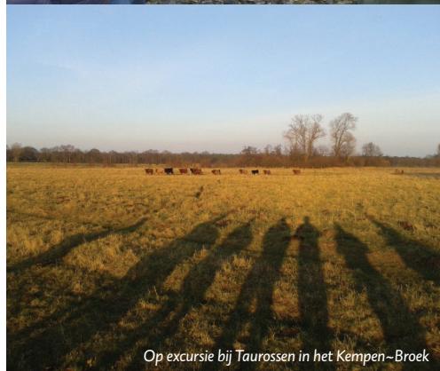
Op excursie bij Taoussen in het Kempen-Broek