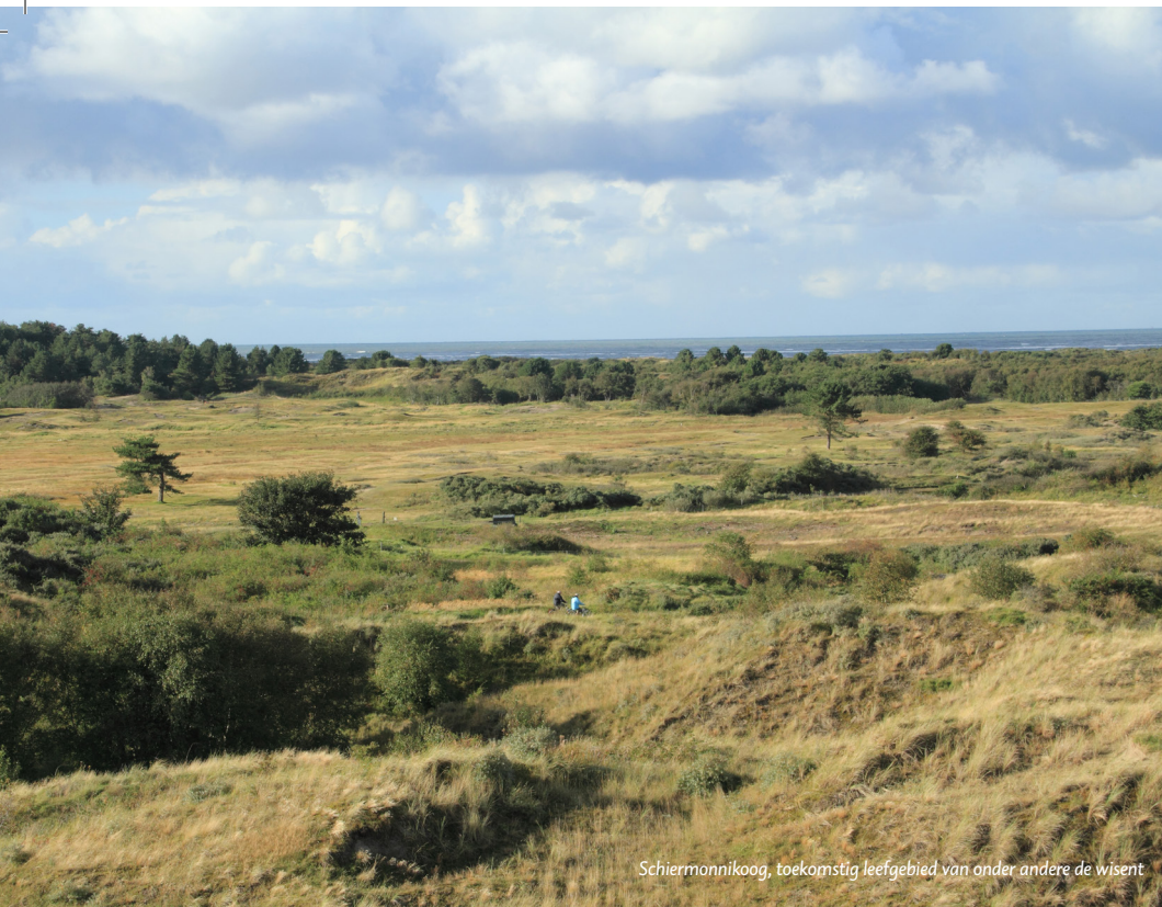
Schiermonnikoog, toekomstig leefgebied van onder andere de wisent