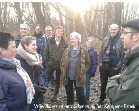
Vrijwilligers en betrokkenen bij het Kempen-Broek