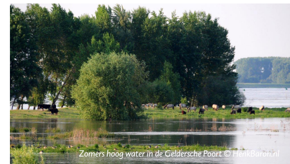
Zomers hoog water in de Gelderse Poort

Wanneer alles volgens planning verloopt doen begin 2015 wisent, wildlevend rund en paard hun intrede in het Nationaal Park Schiermonnikoog. Al jaren groeien grote delen van het duingebied dicht met bomen en struiken, een bedreiging voor belangrijke flora en fauna van het eiland. Voor onder andere tapuit, blauwe kiekendief en velduil is een open duinlandschap van levensbelang. Mechanisch beheer zorgt nu voor het plaatselijk openhouden van het landschap, maar dit is geen duurzame oplossing. De herintroductie van wild levende grote grazers is bovendien een kostenefficiëntere werkwijze. Samen met ruim 30 belanghebbenden heeft FREE Nature in 2013 in opdracht van Natuurmonumenten gewerkt aan een begrazingsplan. 2014 wordt het jaar van de voorbereidingen, zoals het plaatsen van het raster, zodat in 2015 de dieren hun intrede kunnen doen. In eerste instantie wordt begonnen op een beperkt deel van zo'n 200 hectare. Zo kan ervaring worden opgebouwd en kunnen mensen en grazers wennen. Na vastgestelde evaluatiemomenten is het de bedoeling de begrazing stapsgewijs uit te breiden om uiteindelijk grote delen van het eiland te begrazen en duurzaam te beheren.