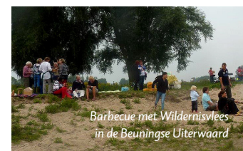
Barbecue met Wildernisvlees in de Beuningse Uiterwaard

Op 27 februari kreeg FREE Nature een check uitgereikt van de organisatie van de Run Beuningen Run. Deze cross run ging dwars