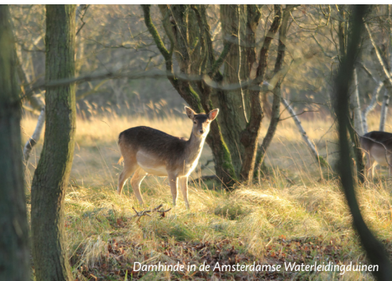
Damhinde in de Amsterdamse Waterleidingduinen

Nieuw bij FREE Nature is de lokale verkoop van vers vlees van Galloway Naardermeer. Vooraf bestellen klanten pakketten vlees die men op vaste dagen kan afhalen. Vlees van Galloway Naardermeer komt gegarandeerd van dieren uit het gebied zelf en het vlees wordt vers aangeboden. www.gallowaynaardermeer.nl