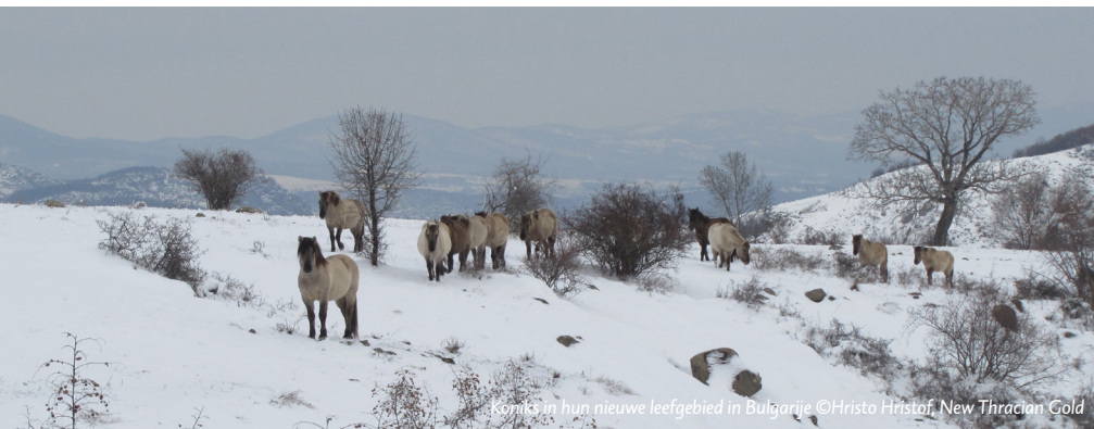
Koniks in hun nieuwe leefgebied in Bulgarije

door de Beuningse Uiterwaarden. Van iedere deelnemer ging € 2,- naar één van de drie geselecteerde goede doelen. FREE Nature dankt de organisatie hartelijk voor hun bijdrage. Het geld is besteed aan een zomerse barbecue voor bezoekers en omwonenden. En zo zie je maar weer, natuur is voor iedereen om van te genieten.