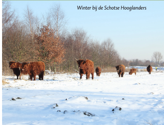
Winter bij de Schotse Hooglanders