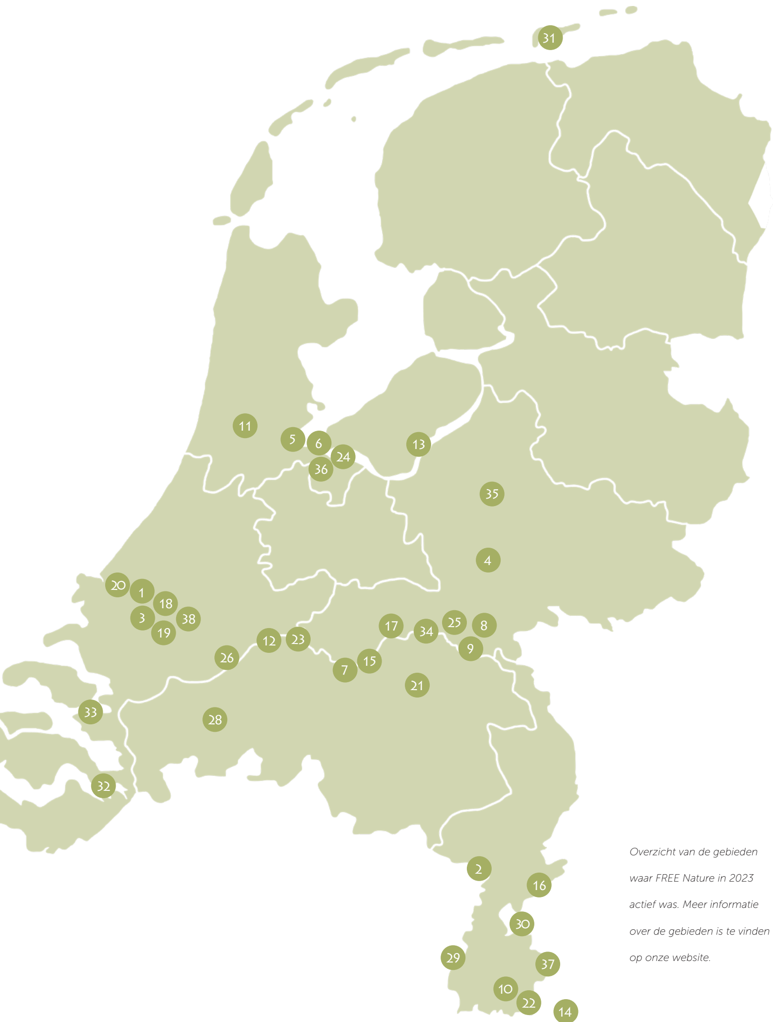
Overzicht van de gebieden waar FREE Nature in 2023 actief was. Meer informatie over de gebieden is te vinden op onze website.